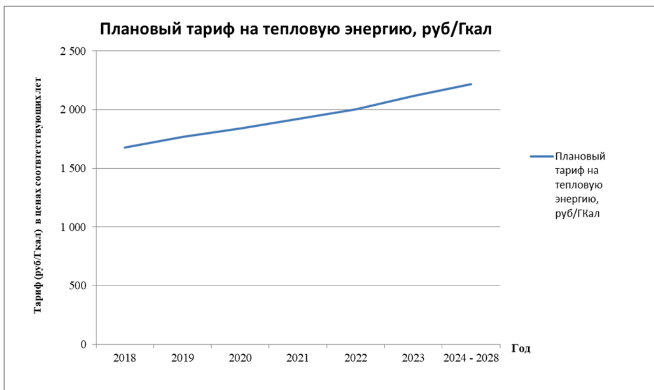
Рисунок 15.3– Плановый тариф для ОАО «Искож»